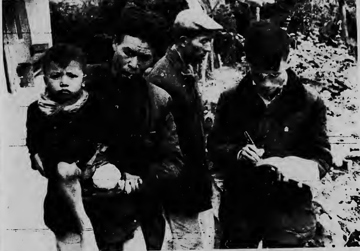
Na e ciudad di Phat Diem na norte di Vietnam, nos por mira un lider catolico teniendo man di su jiu, cual a perde su pia durante un bombardamentu cu a tuma lugar recientemente door di Forza Mericano. Segun e corresponsal di New York Times a bisa, e mucha a perde su mama y tur otro rumannan.